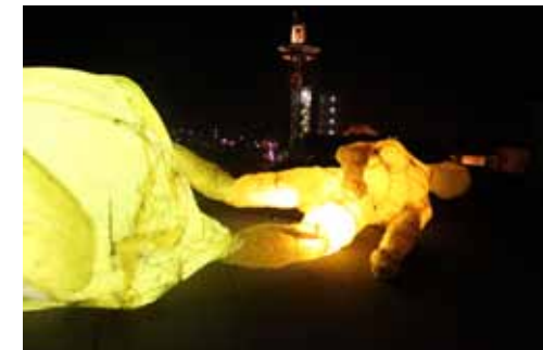
9. Robert Roelink Fallen Humanity