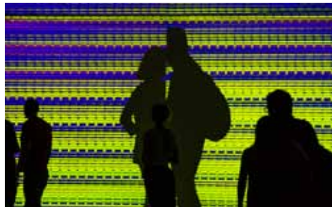
2. Panagiotis Tomaras Hypnograph