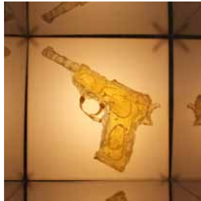
4. Mayke Verhoeven Suikerwerk